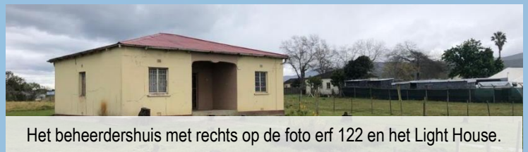
Het beheerdershuis met rechts op de foto erf 122 en het Light House.