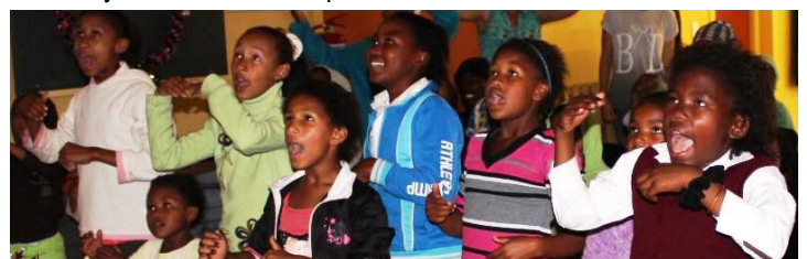
Enthousiaste kinderen tijdens één van de laatste clubs