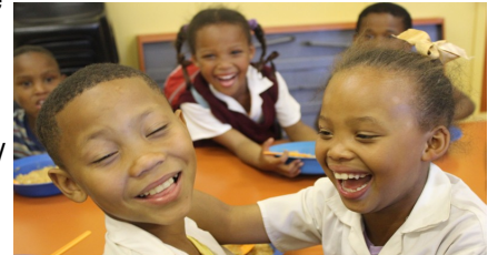
Plezier tijdens het voedselprogramma in Oupad