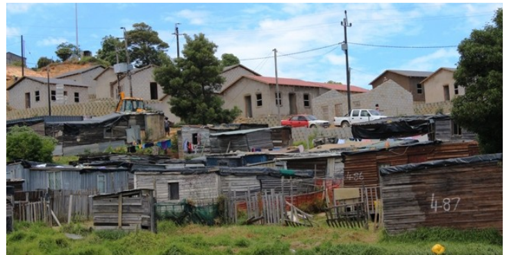
Oude en nieuwe behuizing in Oupad

Het straatbeeld van Oupad is in het afgelopen jaar drastisch veranderd. In Oupad wordt hard gewerkt om stenen huisjes voor de mensen te bouwen. Deze belofte stamt al uit de tijd dat Nelson Mandela nog president was. We vinden het fijn dat de mensen een betere behuizing krijgen maar daarmee zijn alle problemen nog niet opgelost. Wanneer wij aan de achterstandswijken van Knysna denken is de armoedige behuizing niet het grootste probleem. Drankmisbruik, geweld, schoolverlating en tienerzwangerschappen zijn zo maar een aantal zaken die ook moeten worden aangepakt. De problemen gaan dus verder en dieper dan alleen de behuizing.