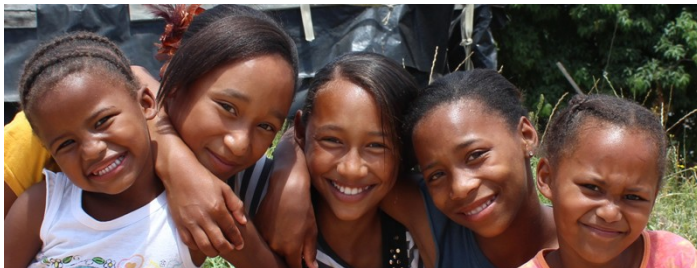
Stralende meisjes uit Oupad

Vorige week trof Theo tijdens een bezoek in een van de wijken van Knysna een ziek meisje aan. Zij lag op een matras op de grond. Het deed hem denken aan de televisiebeelden toen de belangstelling voor de AIDS-epidemie op het hoogtepunt was. Dit meisje bleek AIDS te hebben en al 27 jaar te zijn. Met gratis medicijnen is deze ziekte redelijk te onderdrukken. Haar moeder zei dat ze de discipline niet had om de medicijnen volgens voorschrift in te nemen. Als gevolg daarvan heeft ze twee maanden in het ziekenhuis gelegen met onder anderen een leverontsteking. Ze was nu weer aan de beterende hand. HIV/AIDS is nog steeds een groot probleem in Zuid-Afrika. Goede voorlichting is daarom erg noodzakelijk. Over seksualiteit wordt echter weinig tot niet gesproken in de gezinnen. De informatie over seksualiteit wordt door de tieners van straat gehaald, uit magazines en van televisie. Vaak geven deze media een verkeerd beeld over dit onderwerp.